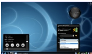
1024x600, "KDE4 @ EeePC 1000" (56)